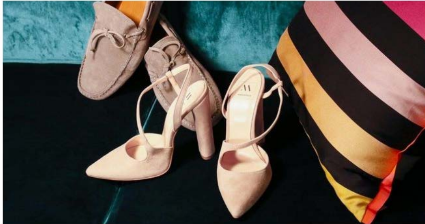
Alcuni modelli di scarpe firmati Made in Italia

Made in Italia sbarca negli USA: il giovane brand di calzature Made in Italy di proprietà della torinese Brandsdistribution entra nel mercato statunitense, grazie all'apertura di un nuovo round di investimenti da 5 milioni di dollari (oltre 4,2 milioni di euro).