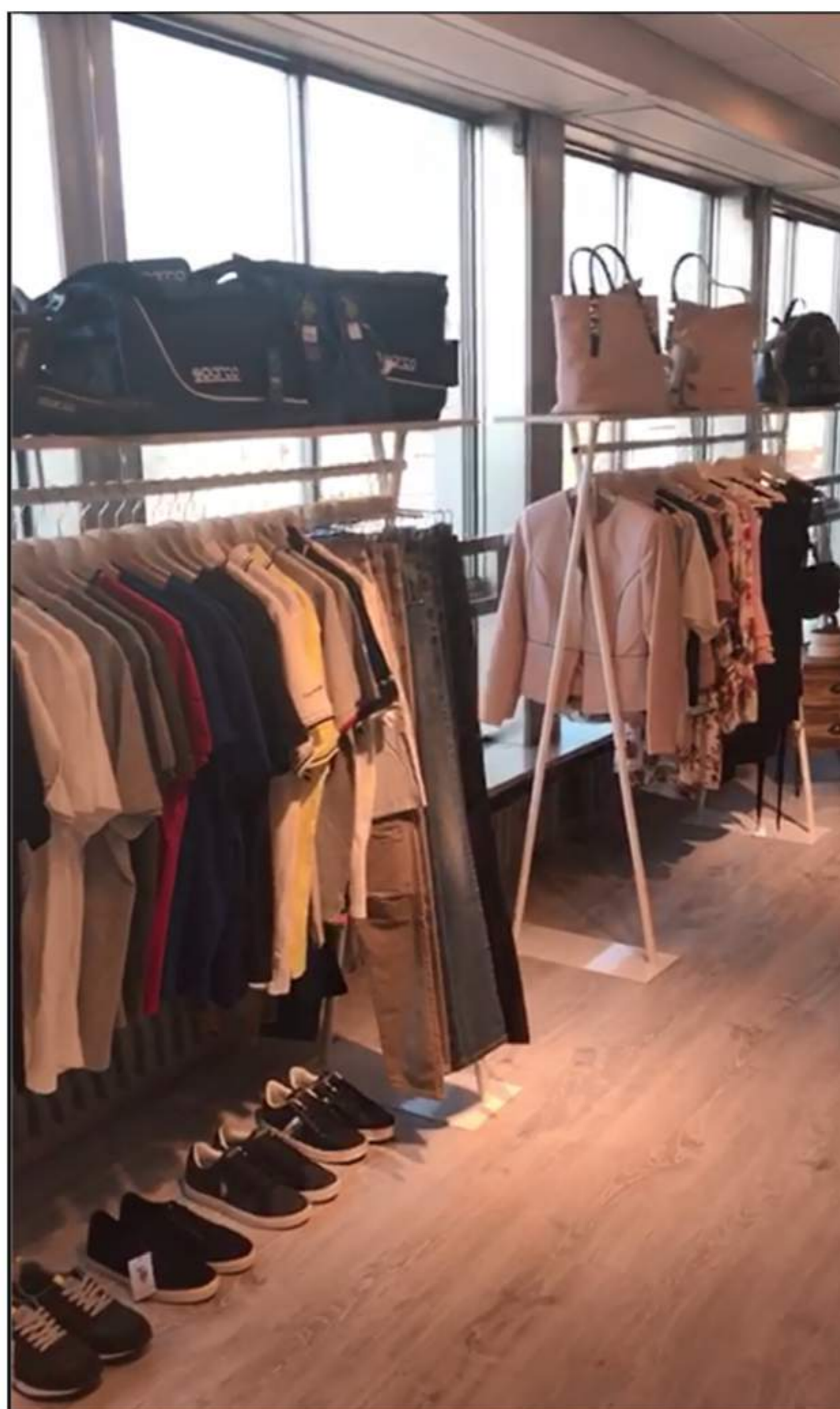
Showroom de Brandsdistribution en Zaragoza - Brandsdistribution

Brandsdistribution sigue proponiendo nuevas fórmulas de negocio en la moda online. El portal italiano acaba de anunciar el lanzamiento del primer modelo de franquicia digital de moda en España.